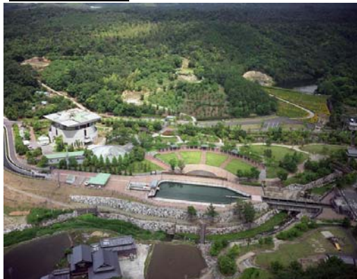
香川用水記念公園