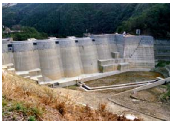
補修工事後の上流面