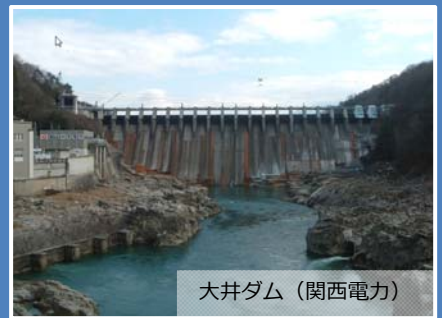
大井ダム (関西電力)