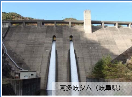
阿多岐ダム (岐阜県)