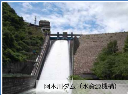
阿木川ダム (水資源機構)