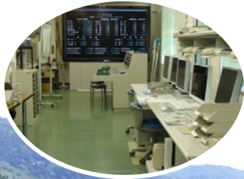
丸山ダム管理所 (操作室)