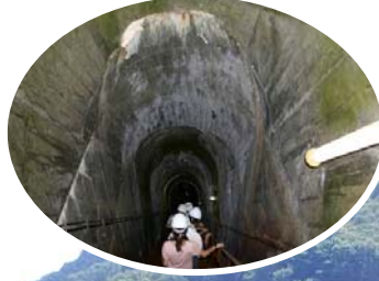
丸山ダム堤体内部