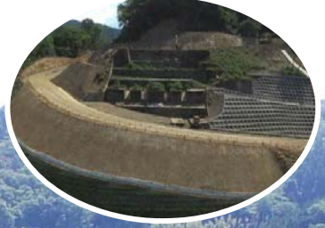
丸山ダム建設時の遺構