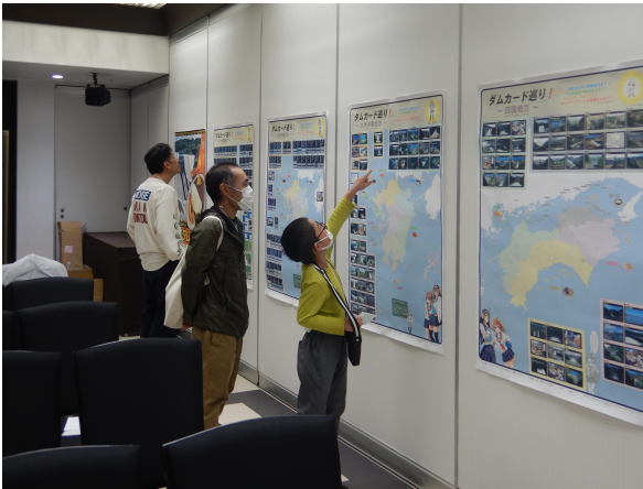
子供さんも参加頂きました