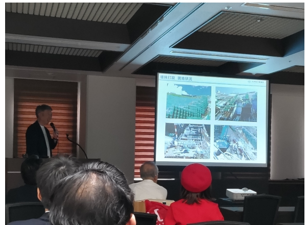
甲斐さまによる講演状況