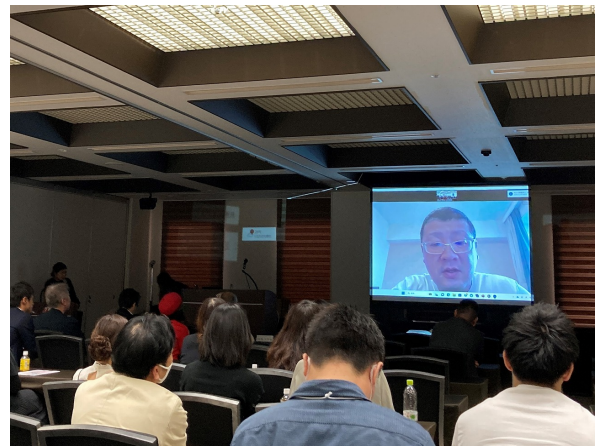
出水さまによる講演状況