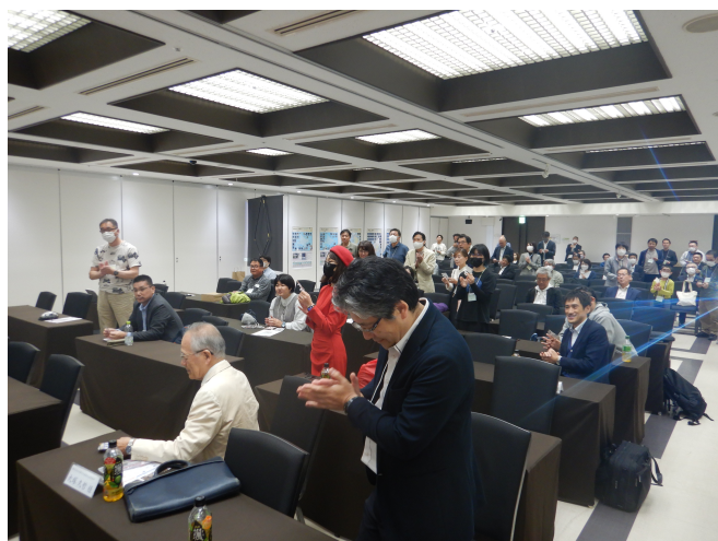
ダム jackpot 開催状況