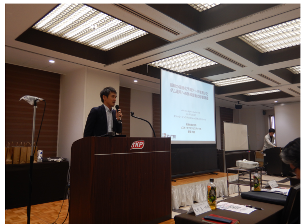
野原さまによる講演状況