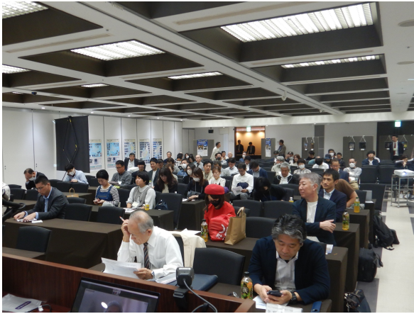
開会前の会場状況