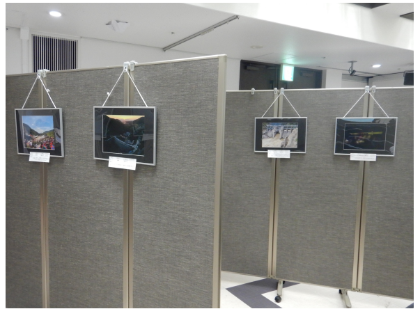
フォトコンテスト応募作品