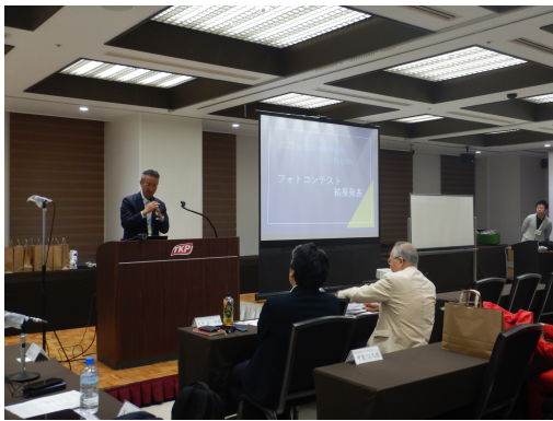
フォトコンテスト発表状況

受賞者には、会場にて受賞コメントをいただき、賞品であるオリジナルダムカードは後日お渡しすることとしました。