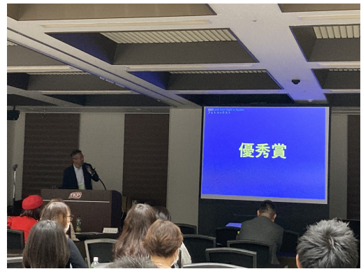
審査発表状況（泉委員）