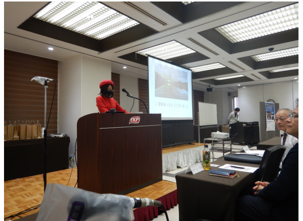
北九州のダム好きさまによる講演状況