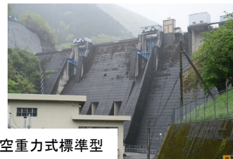
d. 中空重力式標準型