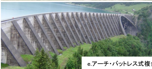
e. アーチ・バットレス式複合型