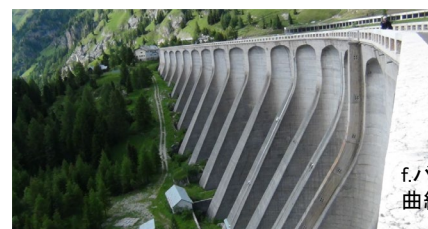
f. バットレス式 曲線スラブ型

内容は学会ホームページ( http://www.jsde.jp/index.html )でご確認ください。