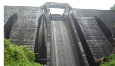
b. 中空重力式セル型