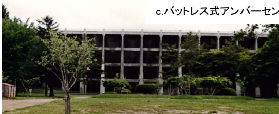
c. バットレス式アンバーセン型