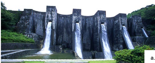
a. 多連アーチ式傾斜型